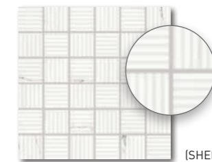
WDR05233 ○ 320 l Netz matt