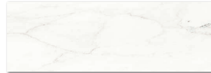
WAKV5233 ○ 710 l m 2 matt

Before laying the tiles, we suggest you select from several cartons and arrange them as illustrated in the inspiration photo documentation in RAKO catalogues or website www.rako.eu , and mix the tiles to achieve the required result including turning them by 180°.