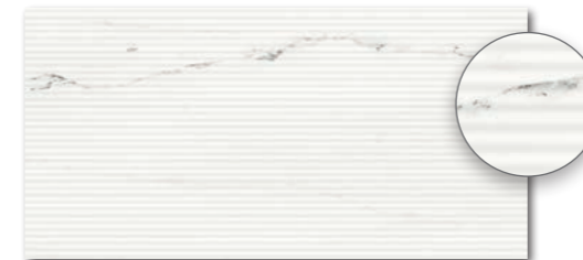
WARVK233 ○ 500 l m 2 matt