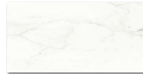
WAKVK233 ○ 500 l m 2 matt