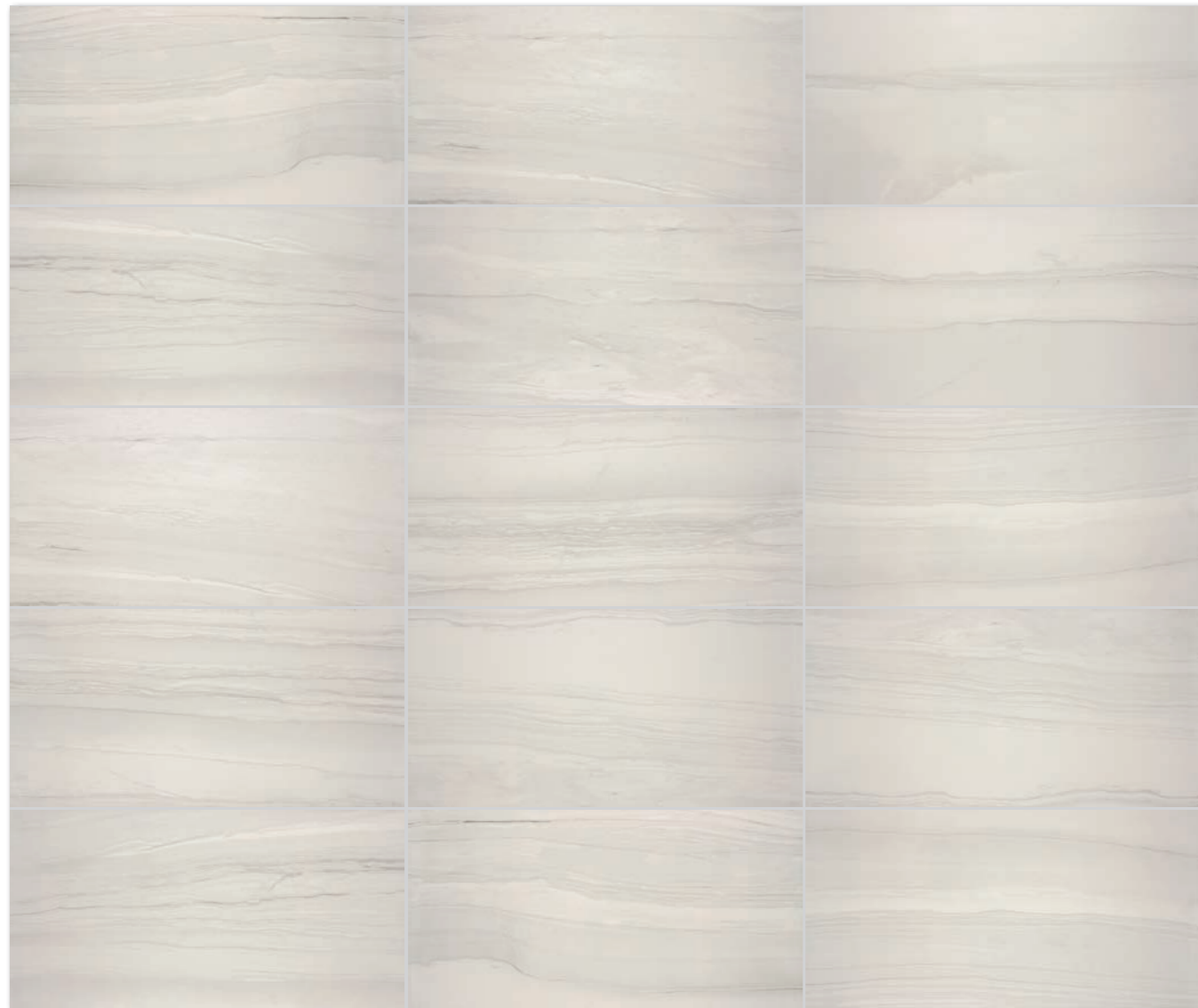
Die Fliesen der Serie zeichnen sich durch ein breites Farbspiel V3 aus. | All products of the entire batch show big deviations in shade difference V3.

Wir empfehlen, einzelne Fliesen aus mehreren Paketen herauszunehmen und den gesamten Bodenbelag nach der Inspirationsfotodokumentation in den Katalogen RAKO, eventuell den Webseiten www.rako.eu , zu komponieren. Wünschenswert ist die Kombination aller Fliesendesigns einschließlich ihrer Drehung um 180°, sodass ausgewogene Optik der verlegten Fläche erzielt wird.