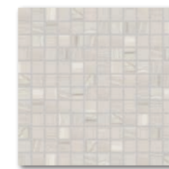
WDM0U526 (SHEET) ○ 760 l Netz matt hellgrau | light grey