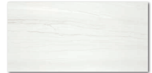
WAKVK525 ○ 500 l m 2 matt