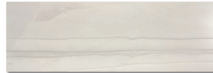
WAKV526 ○ 750 l m 2 matt hellgrau | light grey