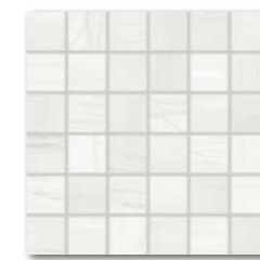
WDM0525 (SHEET) ○ 320 l Netz matt