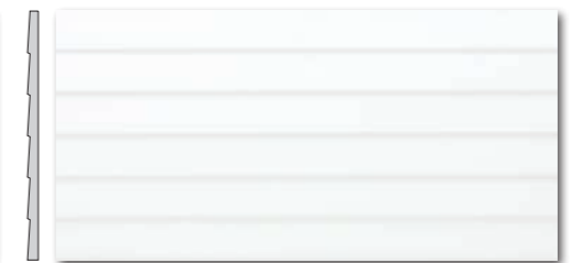
WR1V5000 ○ 750 l m 2 glossy