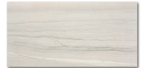
WAKVK526 ○ 500 l m 2 matt