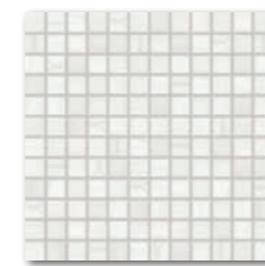
WDM0U525 (SHEET) ○ 760 l Netz matt weiß | white