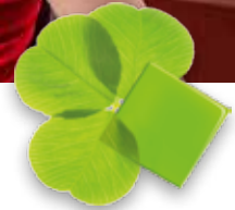
Tabelle 4 – BIII